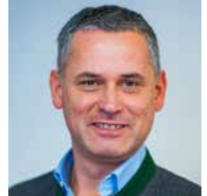
Dir. Christian List Geschäftsführer

A-8151 Hitzendorf 8 T: 03137 600 35 - 00 F: 03137 600 35 - 80 M: 0664 300 90 19 E: office@buero-list.at www.buero-list.at