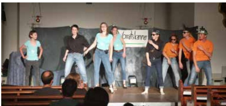
Jugend Musical in der Pfarrkirche Gösting