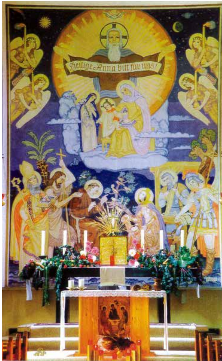
Das heute verdeckte Altarbild von Hans Schrötter

Spruchband: „Heilige Anna bitt für uns“. Der Jesusknabe steht auf einem kleinen Stuhl, seinen linken Fuß hat er auf Annas Oberschenkel abgestützt.