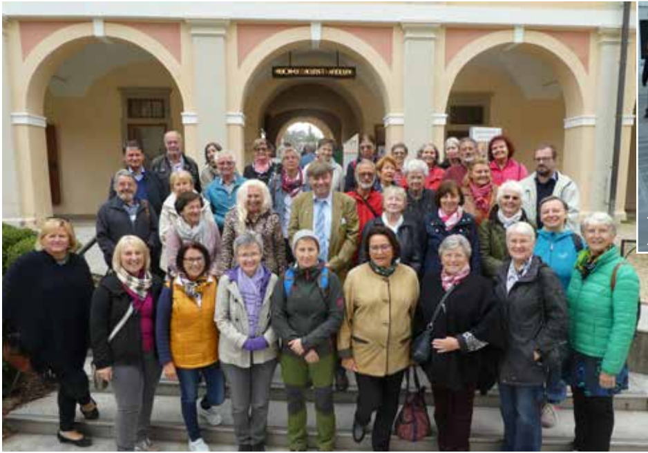
Dank an die Mitarbeitenden: Ausflug am 13. Okt. 2018 nach Seckau, Wiege der Diözese, und nach St. Georgen bei Obdach, wo der Pfarrer Kaplan war