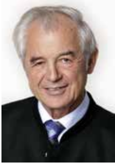
Vizekanzler a.D. DI Josef Riegler

Ob wir es wollen oder nicht: Afrika ist unser Schicksal!