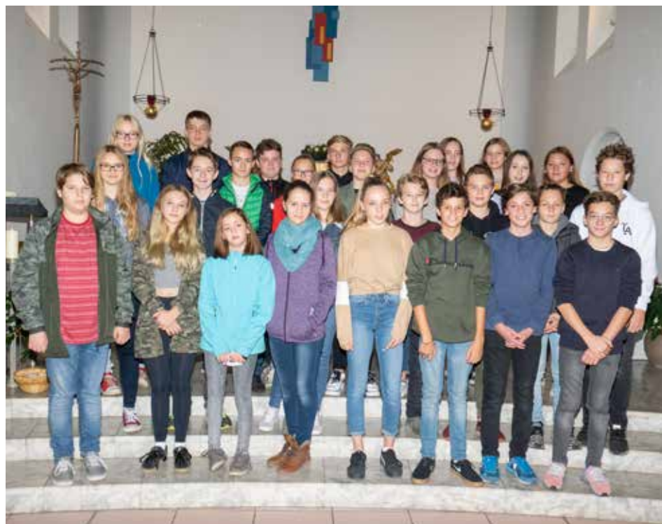
Vorstellung der Firmlinge am 21. Oktober 2018 in Gösting