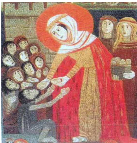
Hl. Elisabeth mit Brot (Pius Kirchgassner)

Mit nur einer Hand lässt sich kein Knoten knüpfen!“ 30 Jahre schon hat die Elisabethrunde gemeinsam