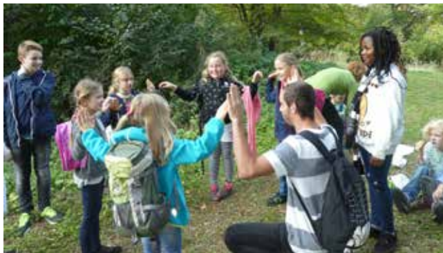
Jung-schar-wanderung auf den Plabutsch