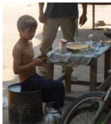
Bedrückende Armut: Mit einem Ein-topf am Tag muss dieser Bub satt werden. Schlangen stehen mit Töpfen vor den Armenausweisungen der Stadt.

DANKE allen, die mitgeholfen haben beim Besuch. Danke für alle Spenden, jede Begleitung und Einladung. Die Probleme im Land sind horrend: 110 % Inflation, die viele in die Armenausweisung treibt; 7 Monate Dürre, die die Ernte vernichtete und das Vieh verdursten ließ. Weiters: viele Kinder haben in der Coronazeit die Schule abgebrochen. Daher ist unser Bildungsprojekt umso wichtiger!