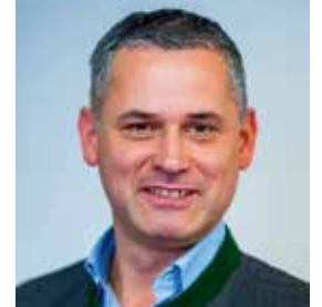
Dir. Christian List Geschäftsführer