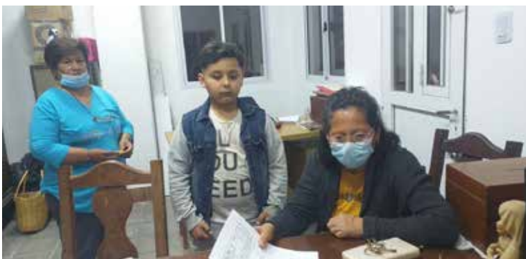
Stipendienauszahlung: Oma kommt mit ihrem Enkelkind. Danke allen PatInnen aus Graz und Thal, die mit € 20.- im Monat 38 Kindern helfen.

DANKE allen, die mitgeholfen haben beim Besuch. Danke für alle Spenden, jede Begleitung und Einladung. Die Probleme im Land sind horrend: 110 % Inflation, die viele in die Armenausweisung treibt; 7 Monate Dürre, die die Ernte vernichtete und das Vieh verdursten ließ. Weiters: viele Kinder haben in der Coronazeit die Schule abgebrochen. Daher ist unser Bildungsprojekt umso wichtiger!