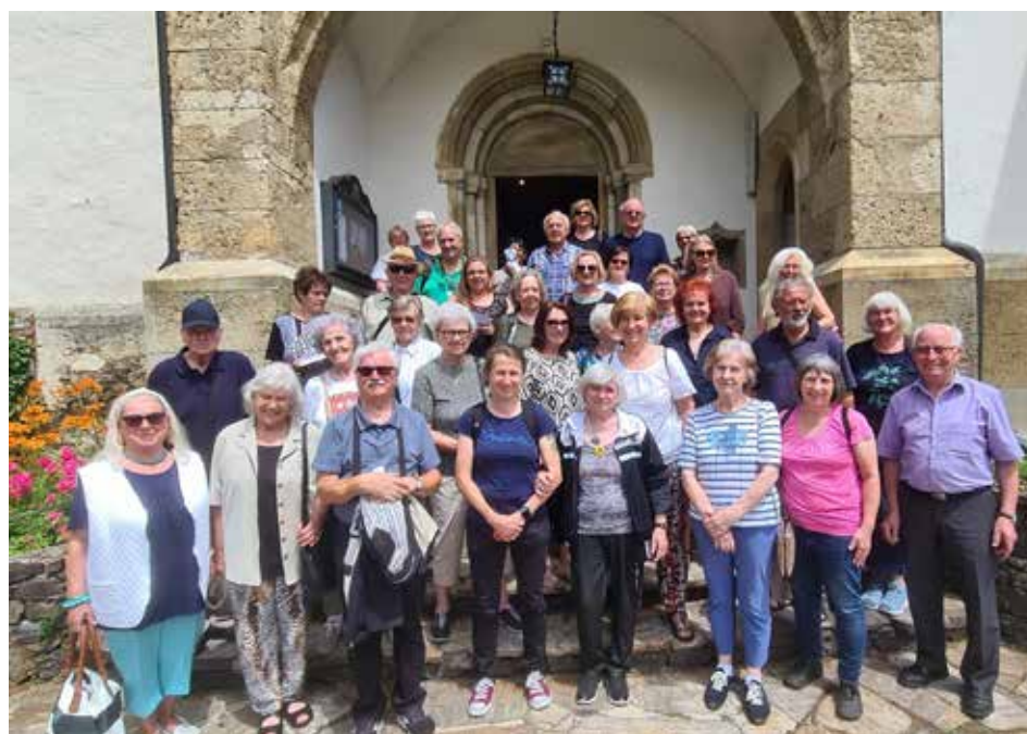
Seniorenwallfahrt an den Wörthersee (Maria Wörth) am 22. Juni mit Gästen aus Argentinien.