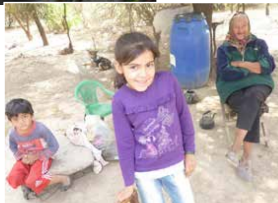
Keine Hilfe vom Staat: Landflucht in AR in der Hoffnung auf Job und Einkommen in der Stadt. Diese Familie existiert für den Staat gar nicht, weil sie keinerlei Dokumente hat. Die Pfarre besorgt Dokumente! Verheerend war die große Trockenheit, 7 Monate kein Regen. Klimawandel in Argentinien.