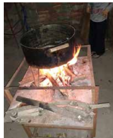
Kochen mit offener Feuerstelle: Wie bei uns vor 100 Jahren müssen viele Familien noch derart kochen. Es fehlt das Geld für Gas. Foto: 20 Personen leben in diesem Haushalt.